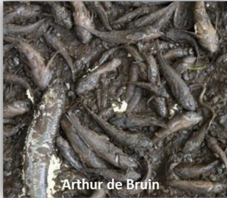
Droogte ramp voor o.a. vis