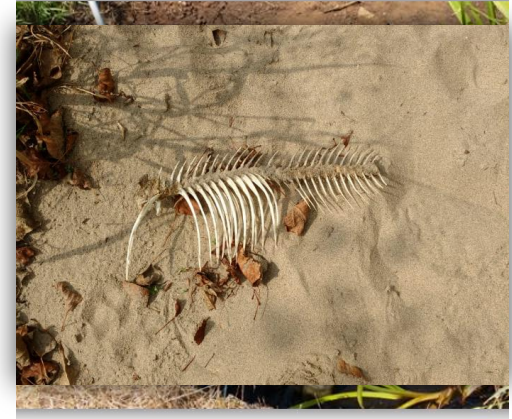
Vrijwillig en beroepsmatig wordt er afgevis

Wat is ecologisch wenselijk; wel/niet afvissen, waar naar toe met vis en zijn er risico's?